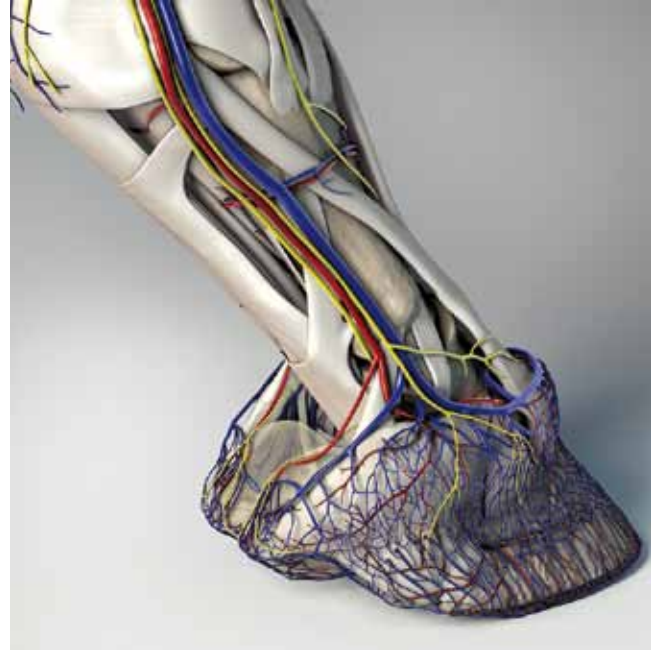
Virtuelles Hufmodell – interaktive Erkundung unter hoofexplorer.com Grafik: Effigos AG