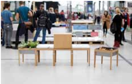
Die zehnte Ausgabe der Designers' Open präsentiert die neusten Trends im Produkt- und Modedesign

Beständig neu – Das sind die Designers' Open. Bereits zum zehnten Mal findet das einmalige Designfestival in und um Leipzig statt: Auf die Besucher warten die neusten Design-Kreationen in einmaliger Atmosphäre. Neben Neuheiten im Mode- und Produktdesign richtet sich die Veranstaltung mit dem eigenen Bereich DO/Industry auch an das Fachpublikum.