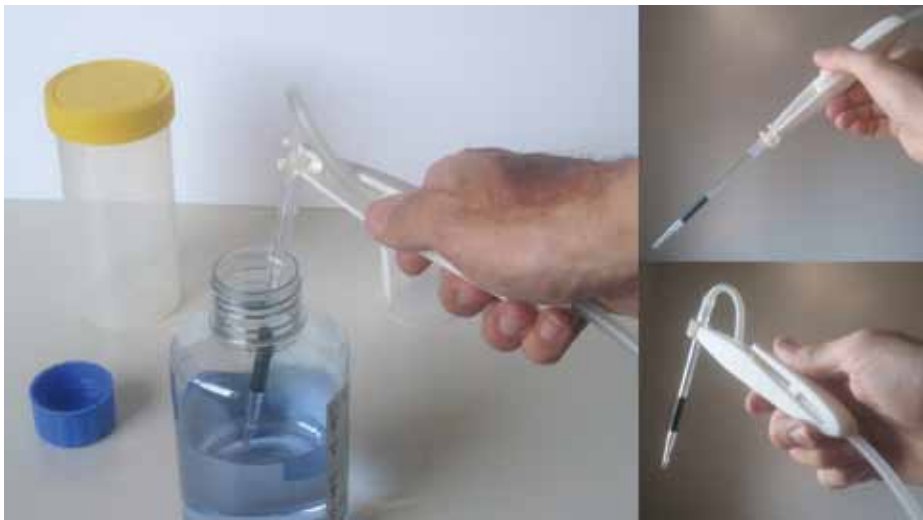
Drei Arbeitshaltungen beim Pipettieren mit Ventilhandstück (Quetschventil)

Im Laborbereich werden häufig unter Sterilbedingungen mit Schutzhandschuhen Flüssigkeiten, z. B. aus Reagenzgläsern abgesaugt oder zugegeben. Dafür stehen dem Laborpersonal eine Reihe von Absaugsystemen unterschiedlicher Anbieter mit Schlauchanschluss zur Verfügung. Ergänzt werden die Systeme durch Handstücke mit und ohne Ventilfunktion, an die auch Hilfsmittel wie z. B. Pipettierspitzen angesetzt werden können.