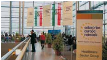
Kooperationsbörse auf der MEDICA

Sie planen mit Ihrer Firma europaweit aktiv zu werden? Sie sind schon aktiv und suchen eine Technologie, die Ihre Aktivitäten ergänzen oder einen Partner, der eine von Ihnen entwickelte, moderne Technologie benötigen könnte. Dann ist das Enterprise Europe Network ( http://een.ec.europa.eu/ ) mit seinen Mitarbeitern immer eine richtige Adresse. Gefördert durch die Europäische Union hilft das Netzwerk kleinen und mittleren Unternehmen, den europäischen Markt bestmöglich zu nutzen.