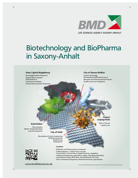
Biotechnologie und BioPharma in Sachsen-Anhalt

Für eine nachhaltige Strukturgebung im Wirtschaftsraum Mitteldeutschland stellen innovative biotechnologische Entwicklungen, Verfahren und Produkte wesentliche Impulsgeber dar. Die biopharmazeutische Entwicklung und Produktion