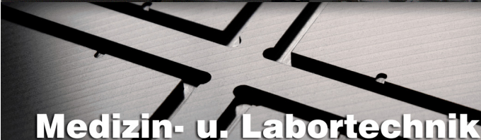
Medizin- u. Labortechnik